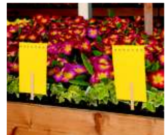
Stake along edges