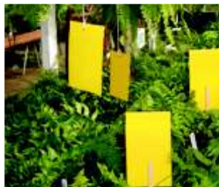
Place in pots or hang